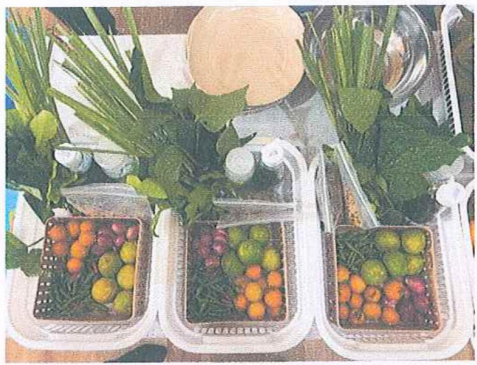
วัสดุงานบ้านงานครัว